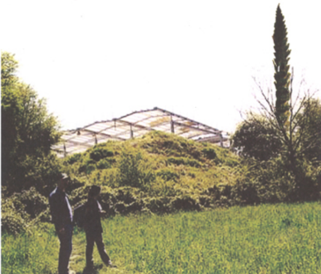
Les Grands Ateliers de l'Isle d'Abeau (Isère)

Ce livre/carnet de chantier restitue, par des textes, des notes, des croquis, des photographies, les ambiances de travail et la belle utopie de ce projet inédit de 1% que l'artiste a tenté de porter, en suivant au plus près celui, originel, des Grands Ateliers.