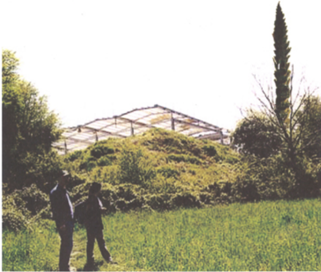
Les Grands Ateliers de l'Isle d'Abeau (Isère)

La construction du bâtiment des Grands Ateliers à Villefontaine (38), conçu par Florence Lipsky et Pascal Rollet en 1999 s'est vu accompagné d'un 1% artistique. L'artiste Christian Philipp Müller fut sélectionné pour concevoir une œuvre en résonance avec le projet culturel des Grands Ateliers. L'artiste a initié l'idée d'une sculpture par un processus de réflexion autour de l'idée et de la perception du concept des Grands Ateliers.